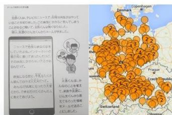
Menschenrechtsbildung im digitalen Raum